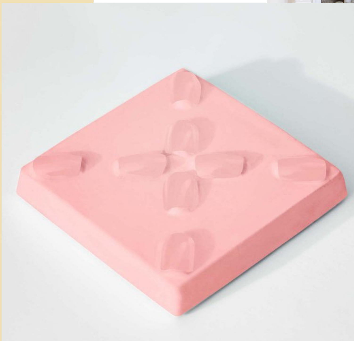
Carreau de faïence

Des petites touches de nuances corail viendront réveiller votre déco ! Les plus téméraires oseront l'appliquer sur un mur entier : ambiance cocooning garantie !