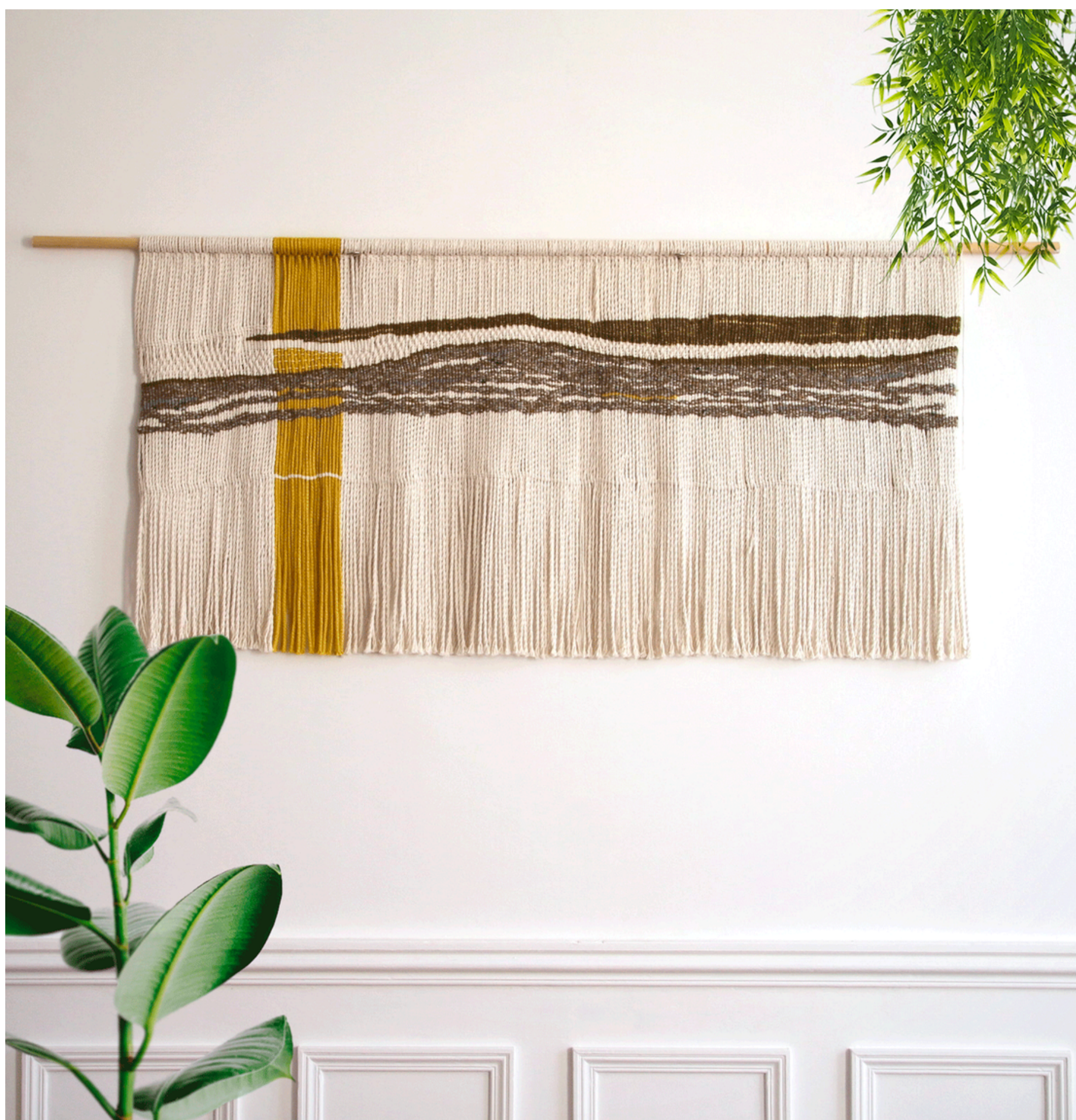
Tissage en coton

Qui dit ambiance nature, dit fibres naturelles ! Pour votre linge de maison choisissez des matières naturelles comme le coton ou le lin. Et si vous vous sentez d'humeur bohème : optez pour des tissages muraux en coton !