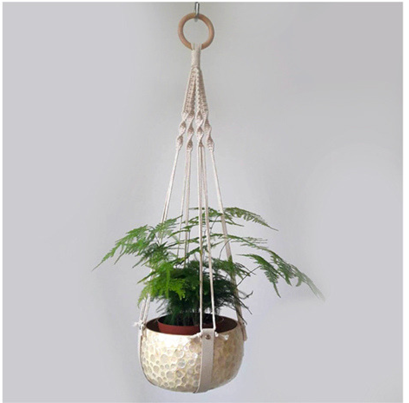
Suspension macramé © ZIAQ