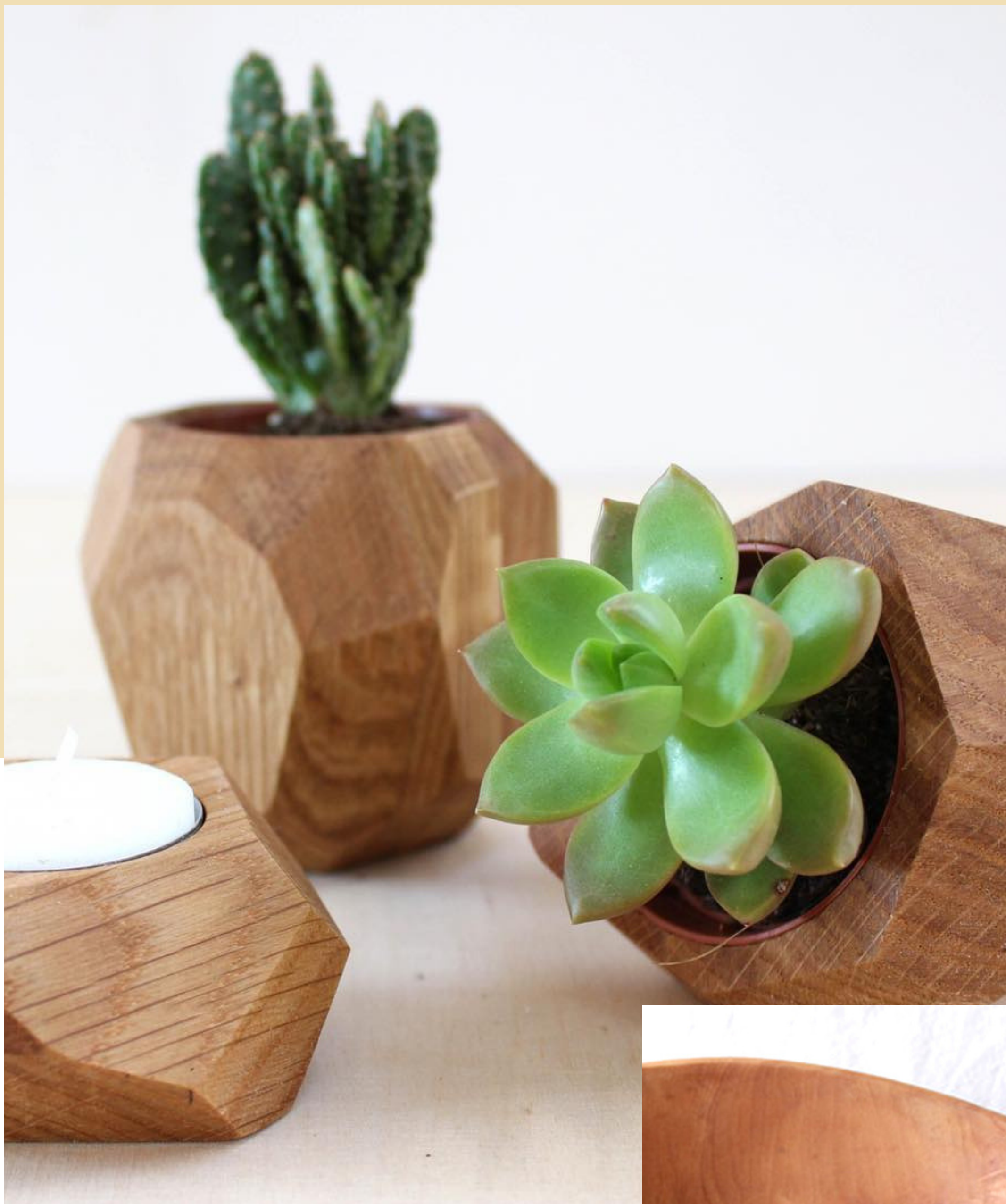
Cache-pot en bois