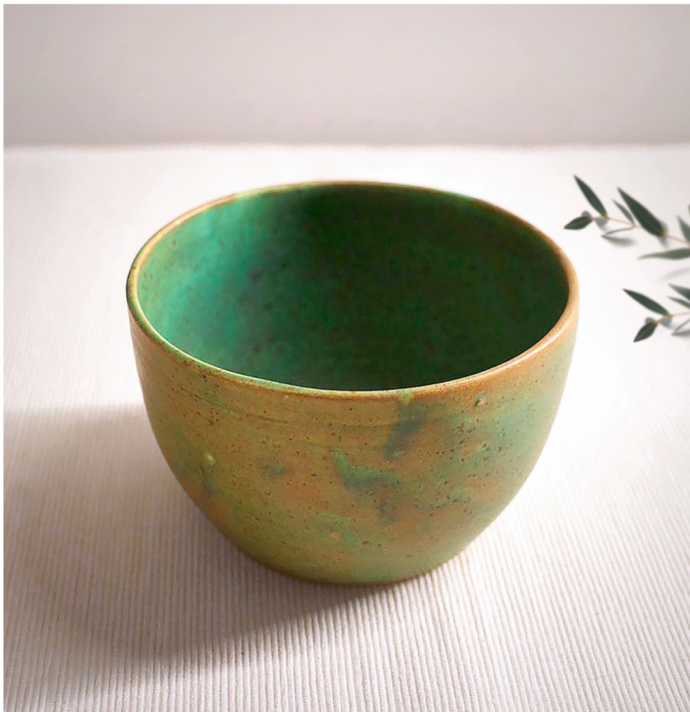
Bol en faïence © Tülin Diker

C'est LA couleur de référence lorsque l'on parle de décoration aux inspirations naturelles, on l'adopte sans modération !