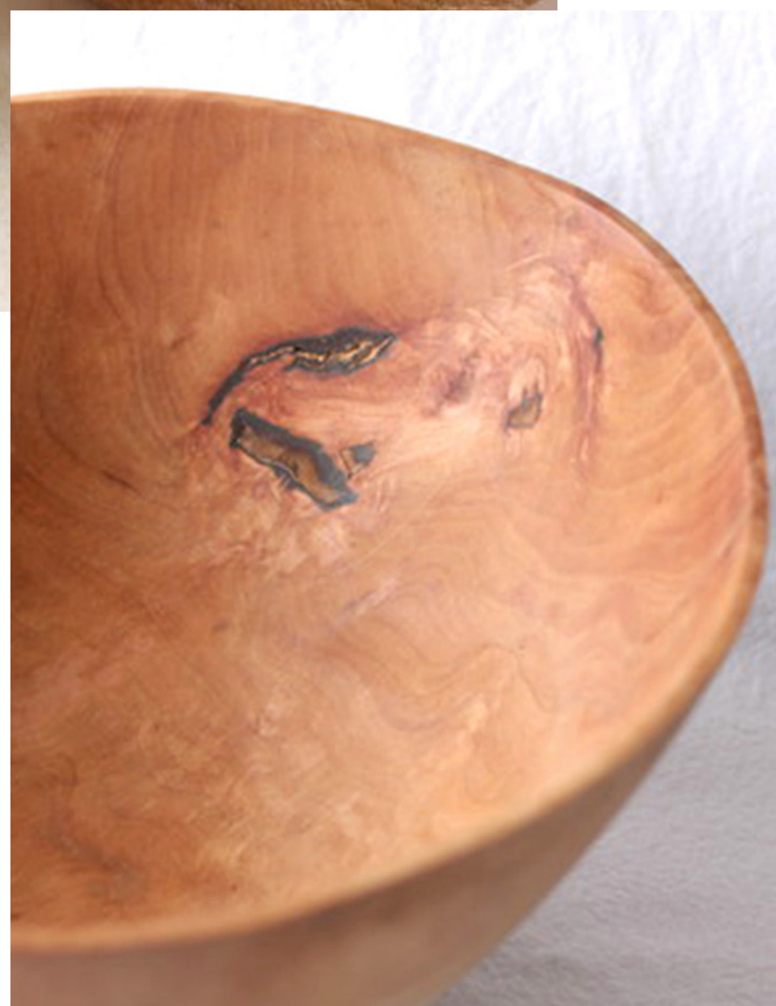
Petit saladier en poirier © Atelier art boisé

Ajoutez quelques accessoires en bois à votre intérieur pour une déco nature & chaleureuse !